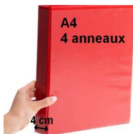
Classeur A4 ; 4 anneaux 4 cm épaisseur