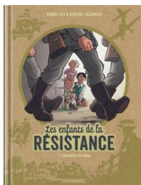
Les enfants de la résistance T1 ISBN : 9782803635580

Ces livres peuvent être trouvés d'occasion assez facilement. N'hésitez pas.