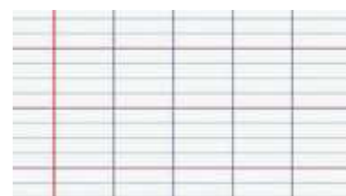
Papier format seyes.

Ces livres peuvent être trouvés d'occasion assez facilement. N'hésitez pas.